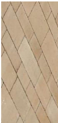
PRZYKŁAD UŁOŻENIA KOSTKI LIBET "VIA-CASTELLO" - KOLOR PASTELLO